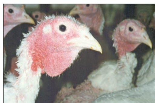
Verletzungsfahr – Puten mit scharfkantigen und spitzen Schnäbeln.

Bei der Gefiederpflege dient der Schnabel den Hühnervögeln vor allem zur Ektoparasitenkontrolle. Die kommen in der modernen Puten- und Wassergeflügelhaltung aber extrem selten vor. In der Legehennenhaltung ist die