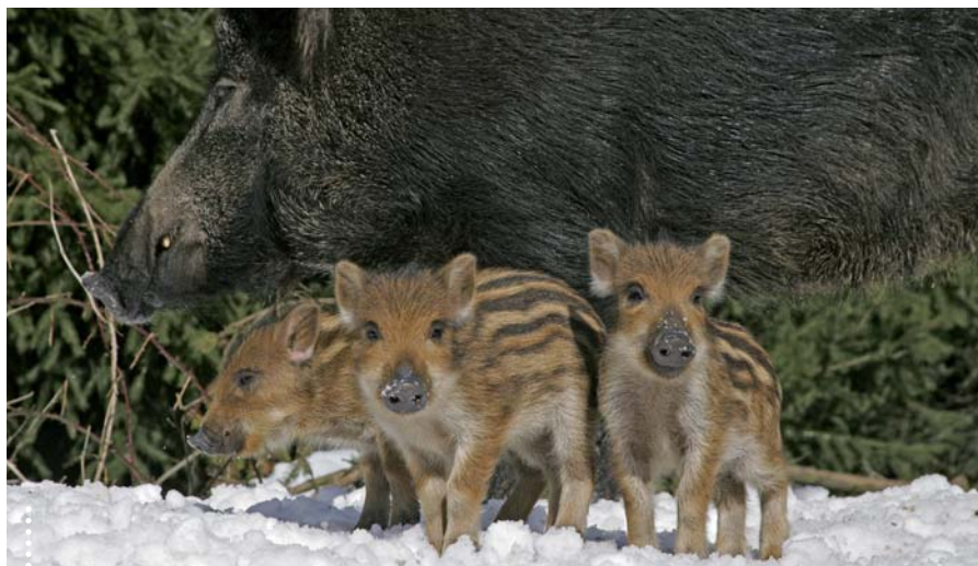
• Gefährdete Frischlinge.

Um auch die Frischlinge sicher zu erreichen, werden inzwischen kleinere Köder ausgelegt. Es hat sich aber gezeigt, dass die Tiere auch diese Köder frühestens im Alter von drei bis vier Monaten aufnehmen. Die mit der Muttermilch aufgenommenen Antikörper schützen die Frischlinge aber nur etwa zwei Monate. Somit bleibt nach wie vor ein hoher Anteil der Jungtierpopulation für das Virus empfänglich. Dies ist bei der Bejagung entsprechend zu berücksichtigen. Ziel ist es, einen Frischlingsanteil an der Jagdstrecke von etwa 70 Prozent zu erreichen. Das beschriebene Verfahren hat sich in Deutschland und zuletzt auch in Frankreich als effektive Bekämpfungsmaßnahme erwiesen. Derzeit wird die Impfung auch in verschiedenen ost-europäischen Ländern, in denen die Wildschweinepest zum Teil noch weit verbreitet ist, eingesetzt. ■